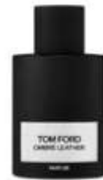
T8 Ombre Leather