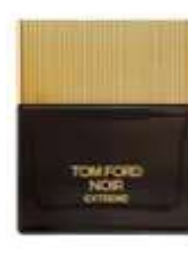
T10 Noir Extreme