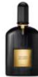
T5 Black Orchid